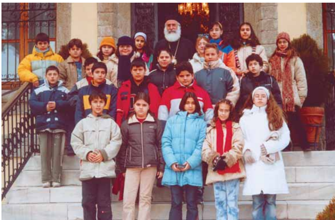
Μέ τούς μαθητές τοῦ ΣΤ1 και ΣΤ2 τοῦ 4ου Δημοτικοῦ Σχολείου κατὰ τὴν ἐπίσκεψή τους στὴν Ἱερά Μητρόπολη.