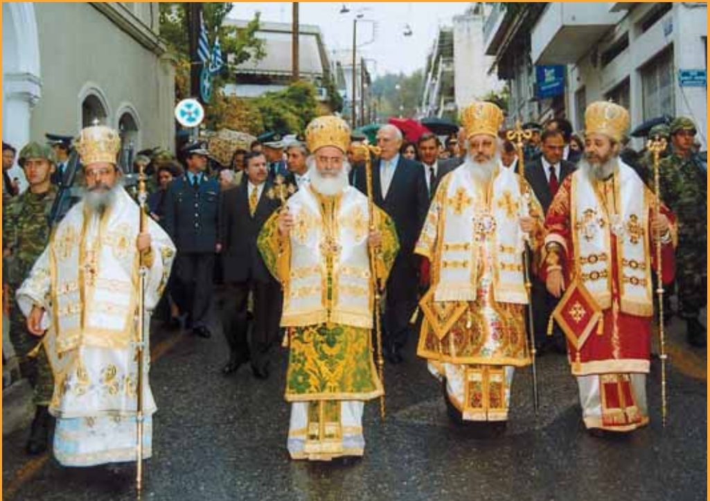
Ἀπὸ τὴν ἑορτὴ τοῦ Εὐαγγελιστοῦ Λουκᾶ, Πολιοῦχου Λαμίας.