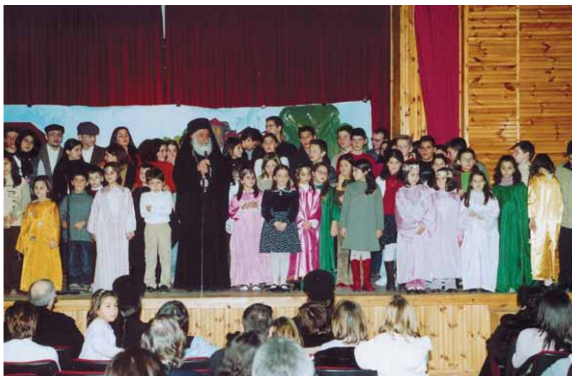
Άπο τήν Χριστουγεννιάτικη γιορτή τών Κατηχητικῶν Σχολείων.