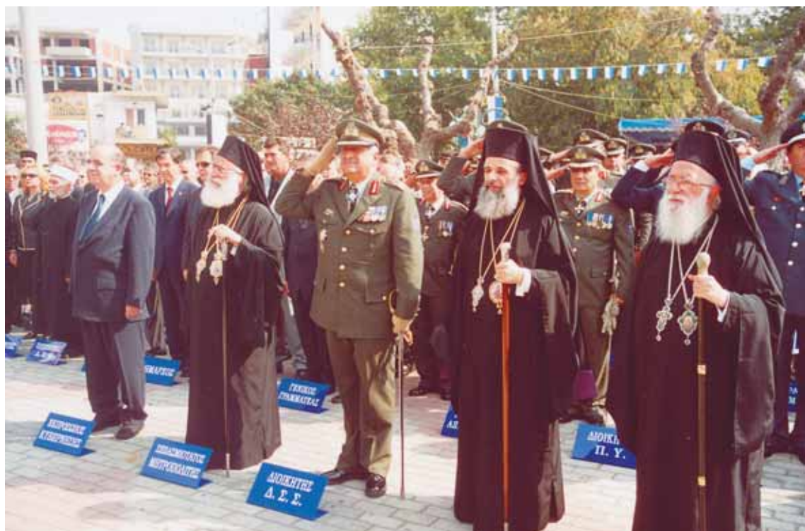
Άπο τά “Ελευθέρια” τής πόλεως.