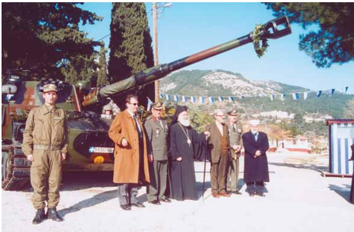
Ἀπό τὴν ἐφορτὴ τοῦ Πυροβολικοῦ τοῦ Δ' Σώματος Στρατοῦ.