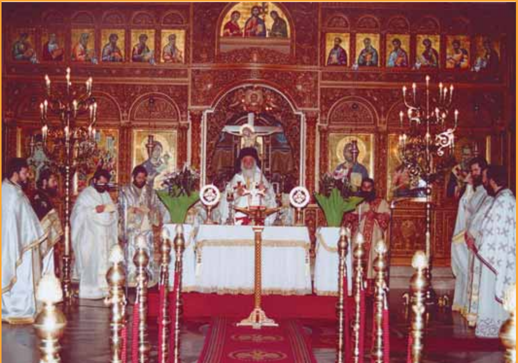
Ἀρχαιοπρεπὴς Θεία Λειτουργία τοῦ Ἁγίου Ἰακώβου τοῦ Ἀδελφοθέου στὸν Ἱ. Καθεδρικό Ναό τῆς τοῦ Θεοῦ Σοφίας.