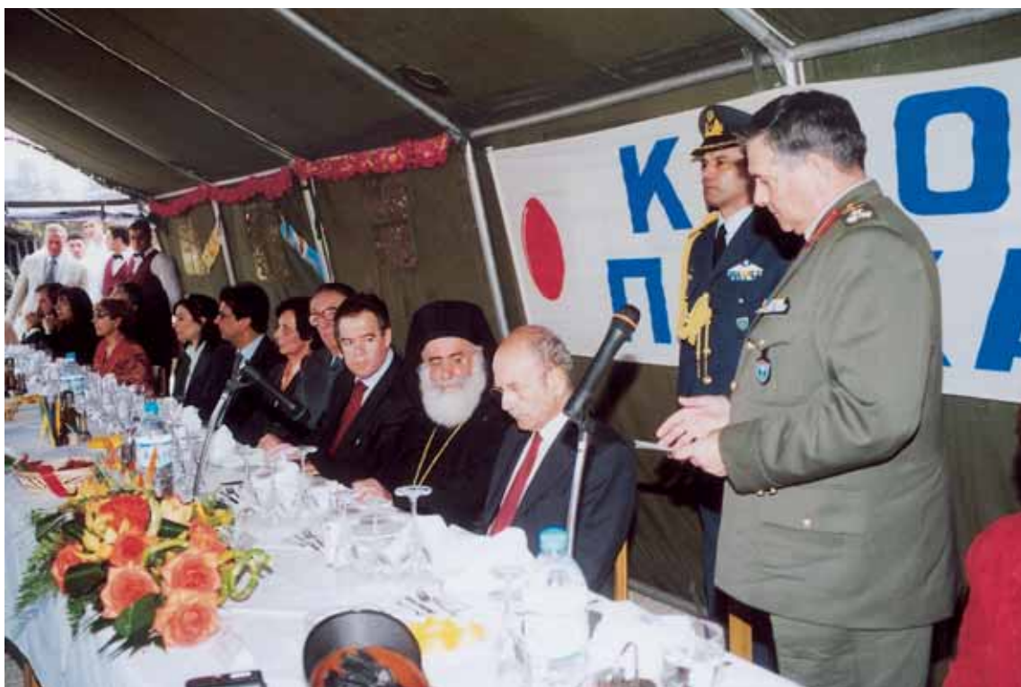
Άπό τόν ἑορτασμό τοῦ Πάσχα μέ τόν Πρόεδρο τῆς Δημοκρατίας στο Δ΄ Σ. Στρατοῦ.