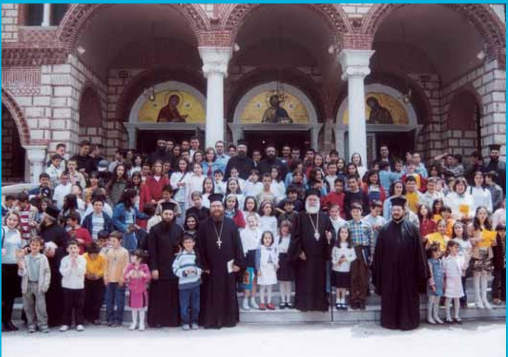
Ἐπί τῆς ἐορτῆς λήξης τῶν Κατηχητικῶν Σχολείων.