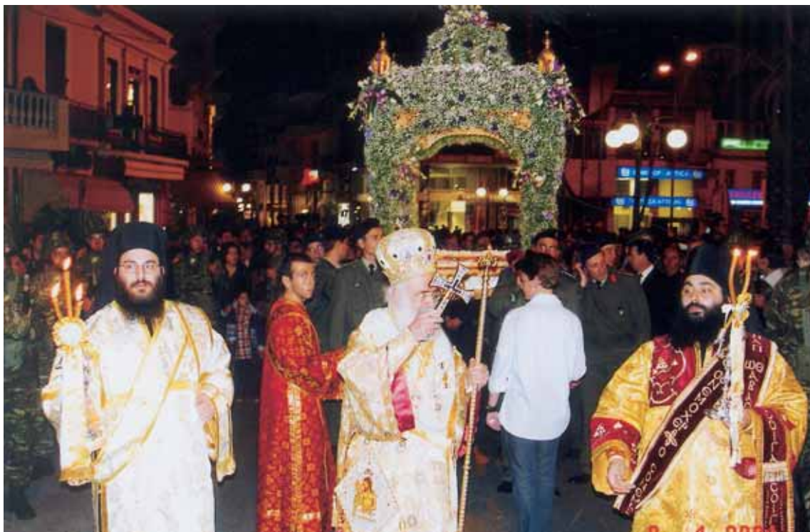
Άπό τή λιτάνευση τοῦ Ἐπιταφίου.