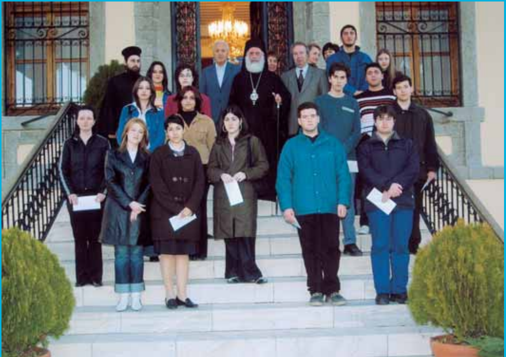
Ὁ Σεβ. Μητροπολίτης Ξάνθης μέ τούς ὑποτρόφους τῶν κληροδοτημάτων Ζαλάχα καί Ἰωακειμείου Ἰδρύματος.