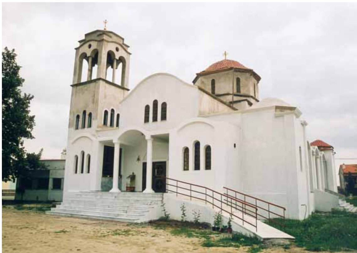
Ὁ νεόδμητος Ἱερός Ναός Ἁγίου Γεωργίου Διομηδείας.