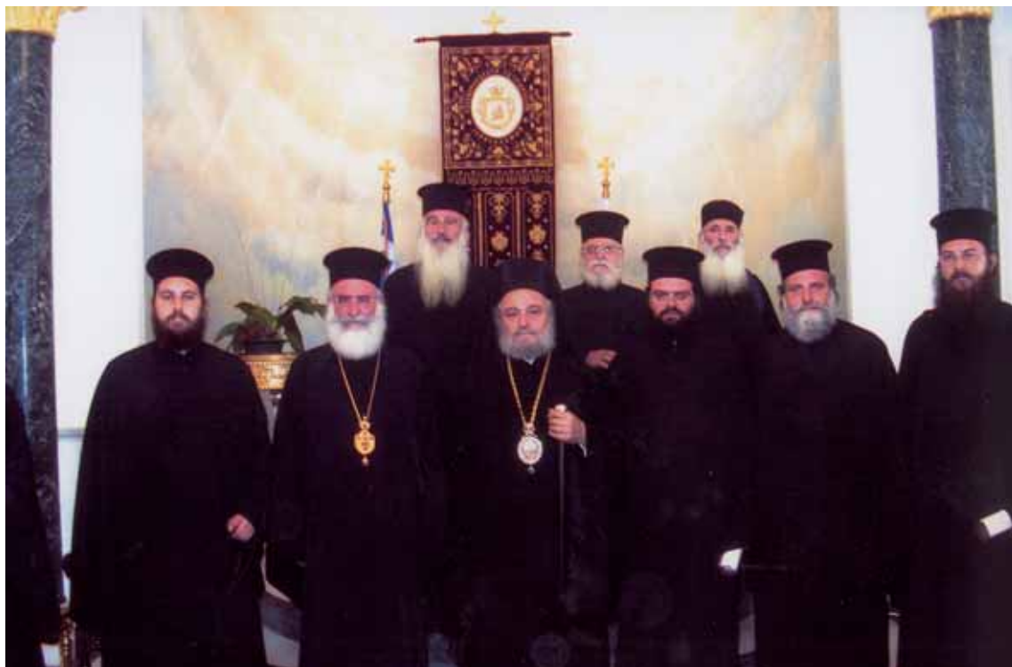
Άπό τήν επίσκεψη στό Πατριαρχεῖο Ἱεροσολύμων.