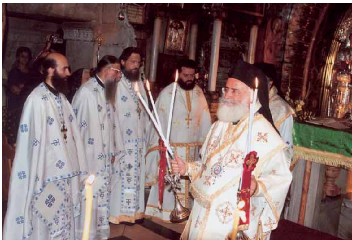
Άπό τήν Θεία Λειτουργία στόν Φρικτό Γολγοθά.