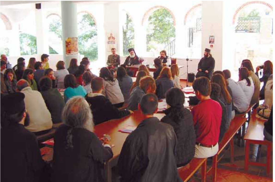
Άπό τήν 5η Συνάντηση Νεολαίων Ἱ. Μητροπόλεων Β. Ἑλλάδος στή Δρυμιά Εἰάνθης.