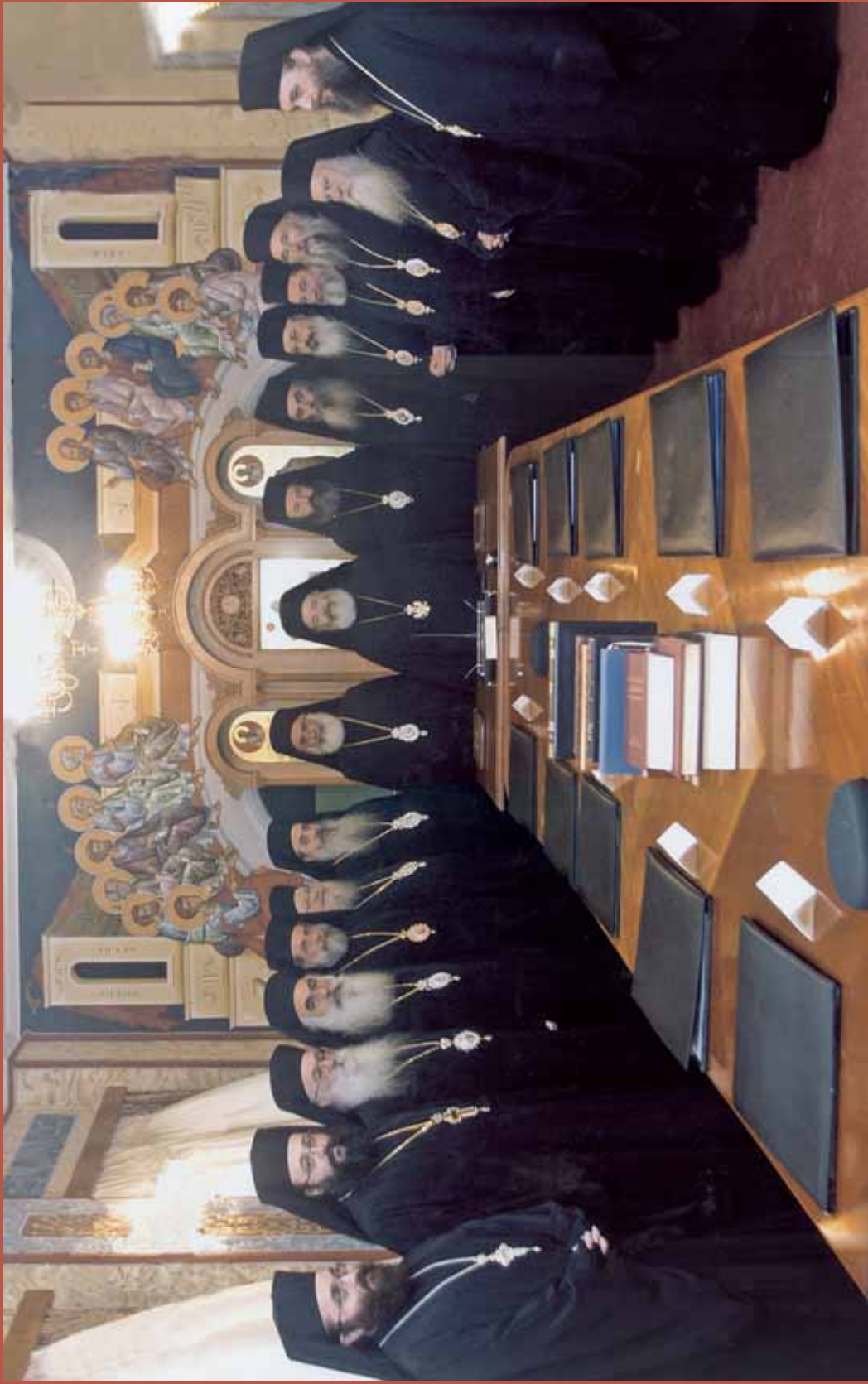
Άπό τήν 148η Περίοδο τῆς Δ.Ι.Σ. τῆς Ἐκκλησίας τῆς Ἑλλάδος.