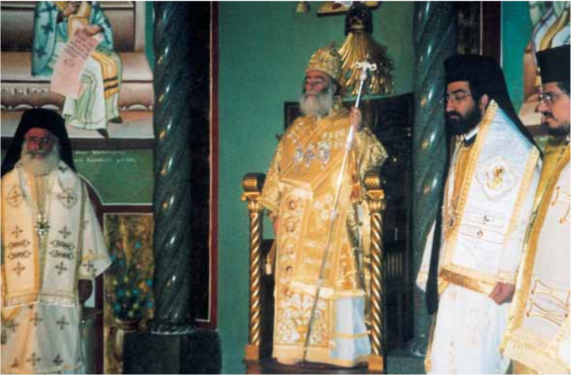
Άπό τήν πρώτη λειτουργία τοῦ Πάπα καί Πατριάρχη Ἀλεξανδρείας κ.κ. Θεοδώρου.