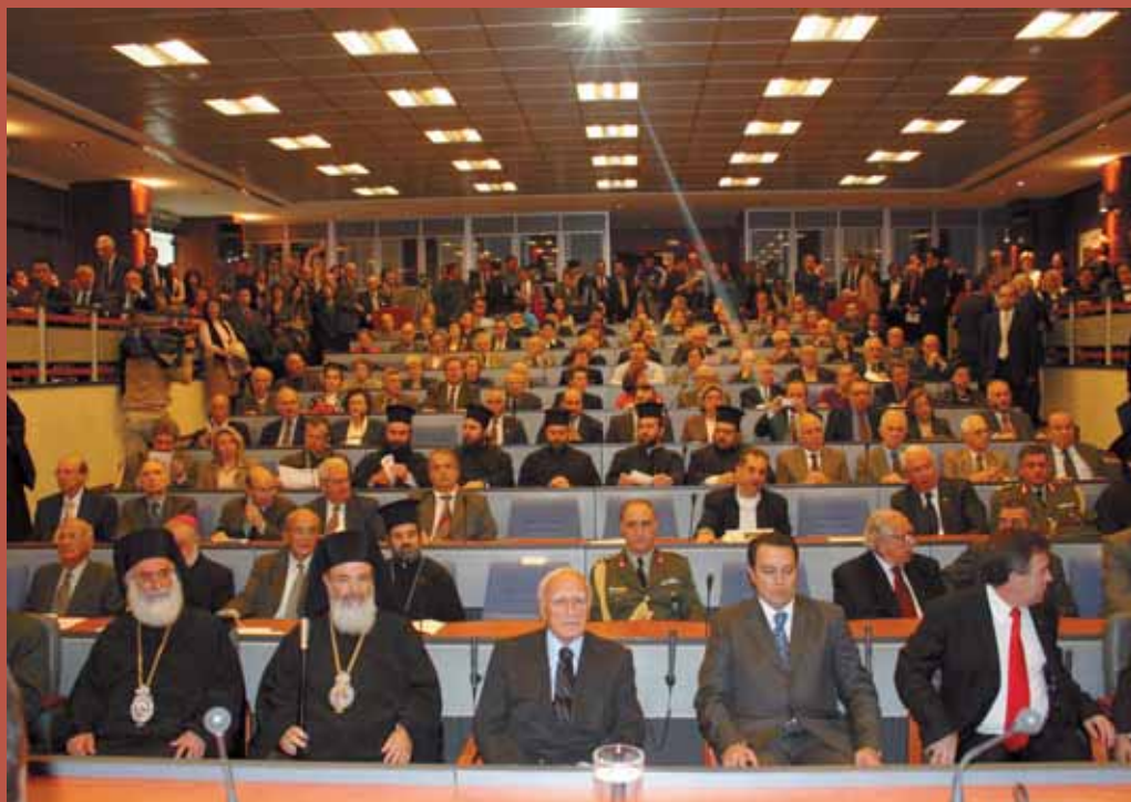
Ἀπὸ τὴν παρουσίαση τοῦ τόμου “Θρησκευτικὰ Μνημεῖα στὸ Νομὸ Ἐάνθης”, στὸ Ὑπουργεῖο Ἐξωτερικῶν