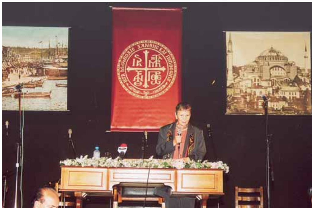
Άπο τὴν ἐκδήλωση “Ἡ καθ’ ἡμᾶς Ἀνατολή” με ὀμιλήτρια τὴν καθηγήτρια Ἑλένη Γλύκατζη-Ἀρβελέρ στο Δημοτικὸ Ἀμφιθέατρο Ξάνθης.