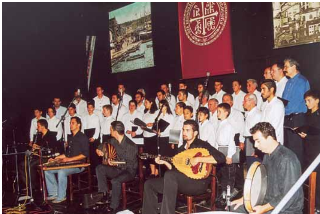
Ἀπὸ τὴν ἐκδήλωση “Ἡ καθ’ ἡμᾶς Ἀνατολή” στὸ Δημοτικὸ Ἀμφιθέατρο Ἐάνθης.