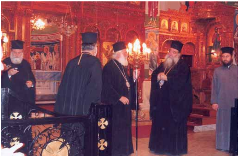
Ἐπίσκεψη στὴν Ἱερὰ Μητρόπολη Φιλαδελφείας (Ἀμμάν Ἰορδανίας).