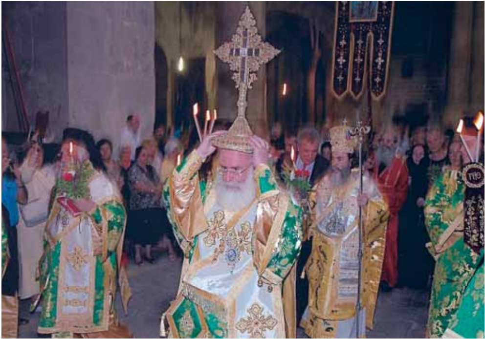
Ἡ περιφορὰ τοῦ Τιμίου Σταυροῦ στὸν Ἱερό Ναὸ τῆς Ἀναστάσεως.