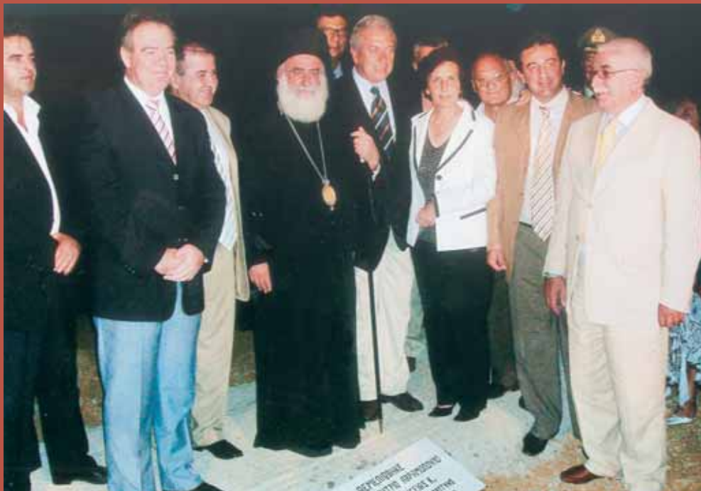
Άπο την θεμελίωση τοῦ Κέντρου Ὑγείας Ἀβδήρων.