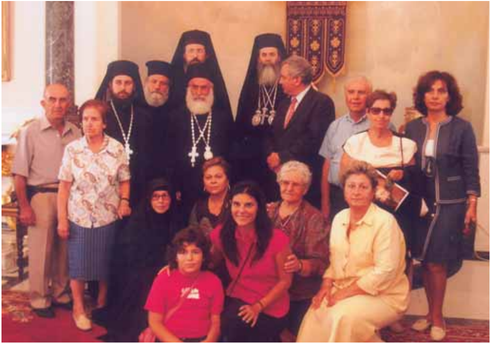
Ἐπίσκεψη στὸ Πατριαρχεῖο Ἱεροσολύμων.