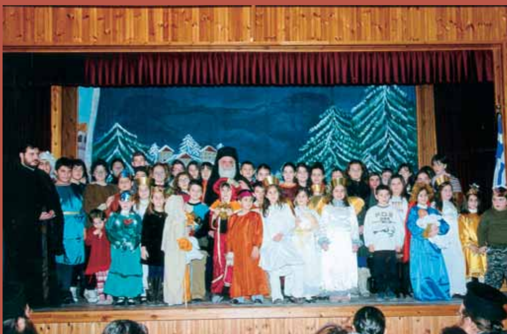
Ἡ Χριστουγεννιάτικη γιορτὴ τῶν Κατηχητικῶν Σχολείων.